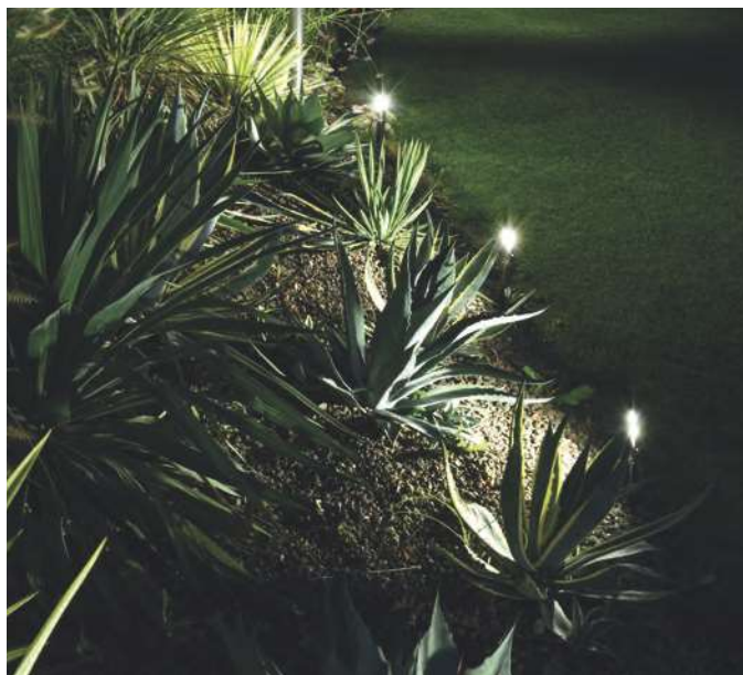
Private Villa - Verona - Italy